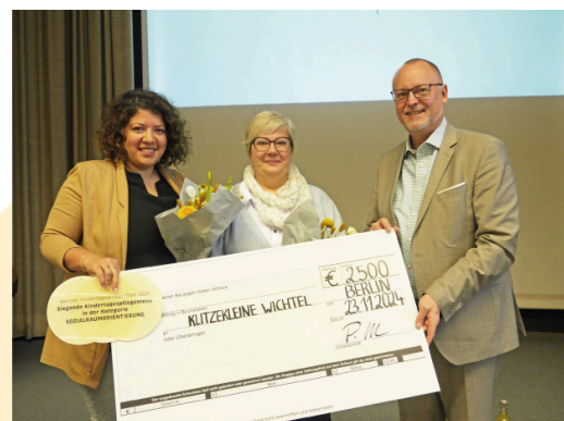
Kindertagespflegestelle Klitzeleine Wichtel